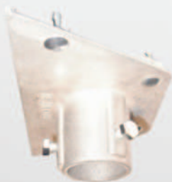
Rohraufsatz 42 mm Pipe socket 42 mm