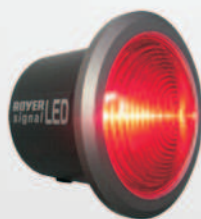
100 mm LED-Box