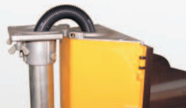
Klappsystem LS 200 Folding system