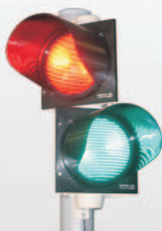
Schwenkadapter Rotatable adapter