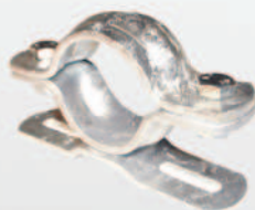
Rohrschelle Pipe clamp