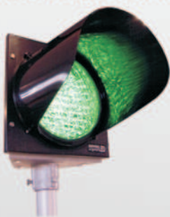
Rohraufsatz Pipe socket