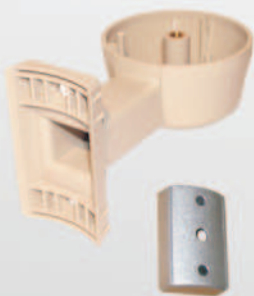
Haltearm/Wandadapter fastening arm/wall adapter