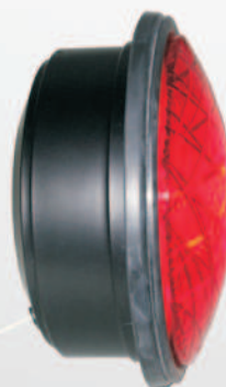
200 mm LED-Modul