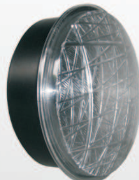
200 mm DUO-LED